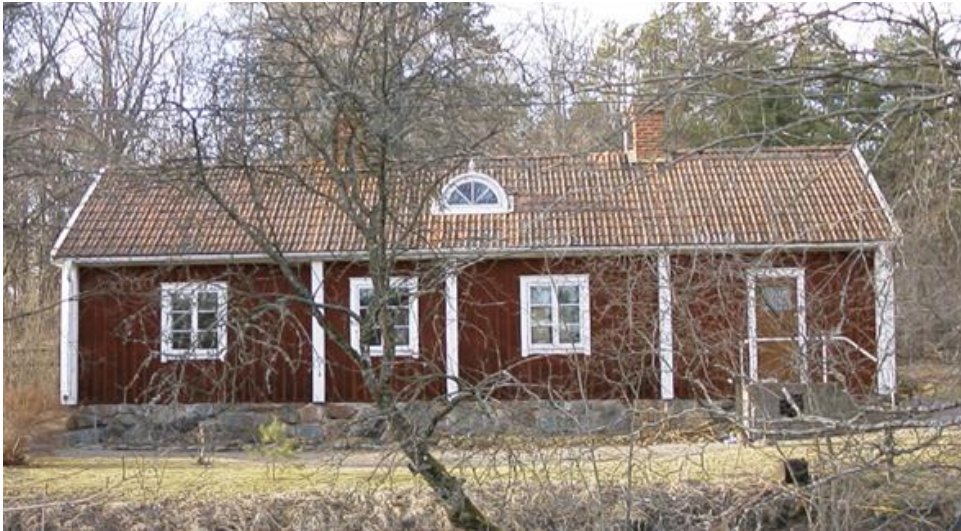
Gammelgården år 2003

Enligt ett kyrkoråds-/stämmoprotokoll från år 1862 föreslog A Anderzon att den gamla klockarstugan skulle auktioneras ut ännu en gång för att få ett högre pris. Man försökte alltså sälja klockarstugan. Timrade hus är ju byggda stock för stock och kan därför också demonteras stock för stock och återuppbyggas på en annan plats. När klockarstugan sedan flyttades, placerades den på mark som tillhörde A Anderzon. Hur mycket betalade han?