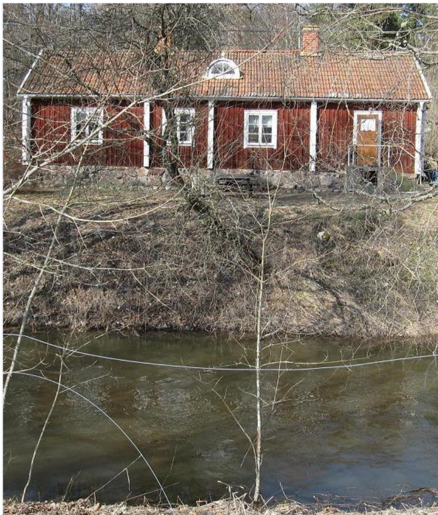
Gammelgården år 2003