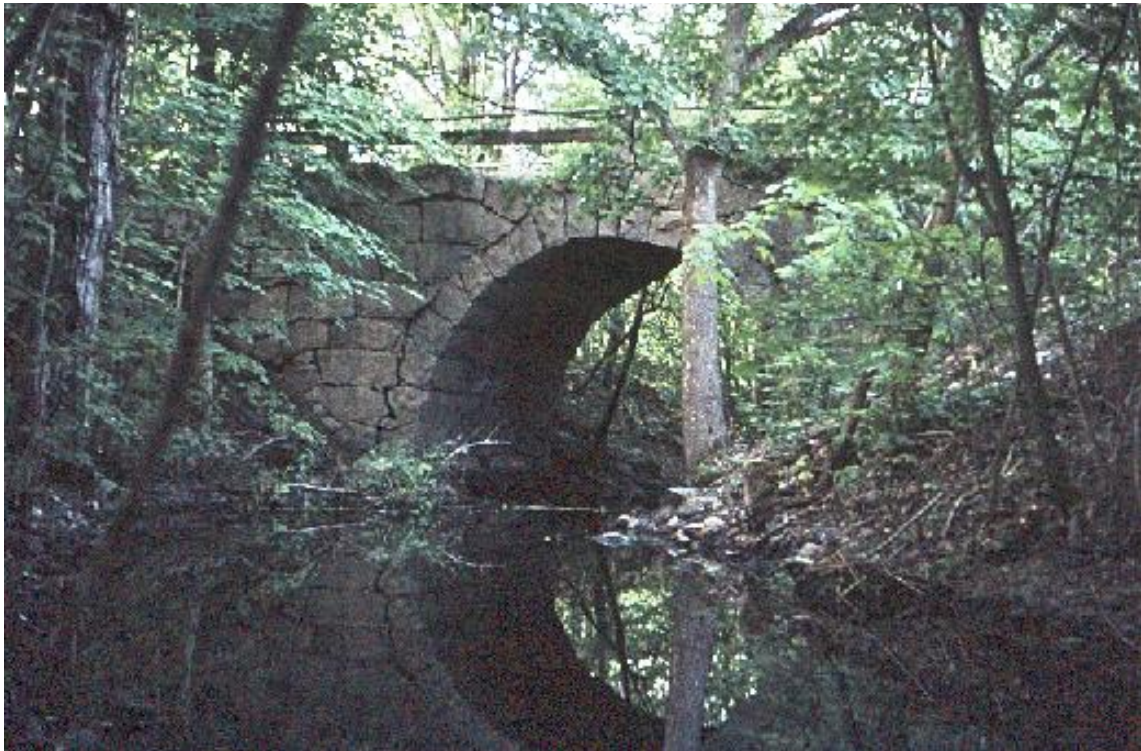
”Diket” vid stenvalvsbron år 1964