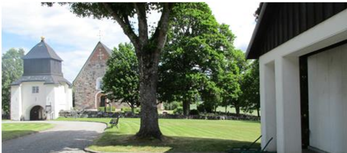
Klockarstugans ursprungliga läge

Enligt Wikipedia, var ”klockare ett kyrkligt ämbete, som ursprungligen – under medeltiden – medförde uppgiften att vårda kyrkan och dess inventarier samt ombesörja klockringningen. På 1600-talet började man av klockaren kräva förmågan att undervisa i sång och leda kyrksången där en särskild kantor inte fanns. Vid samma tid fick klockaren även uppdrag att lära ungdomen att läsa och skriva”.