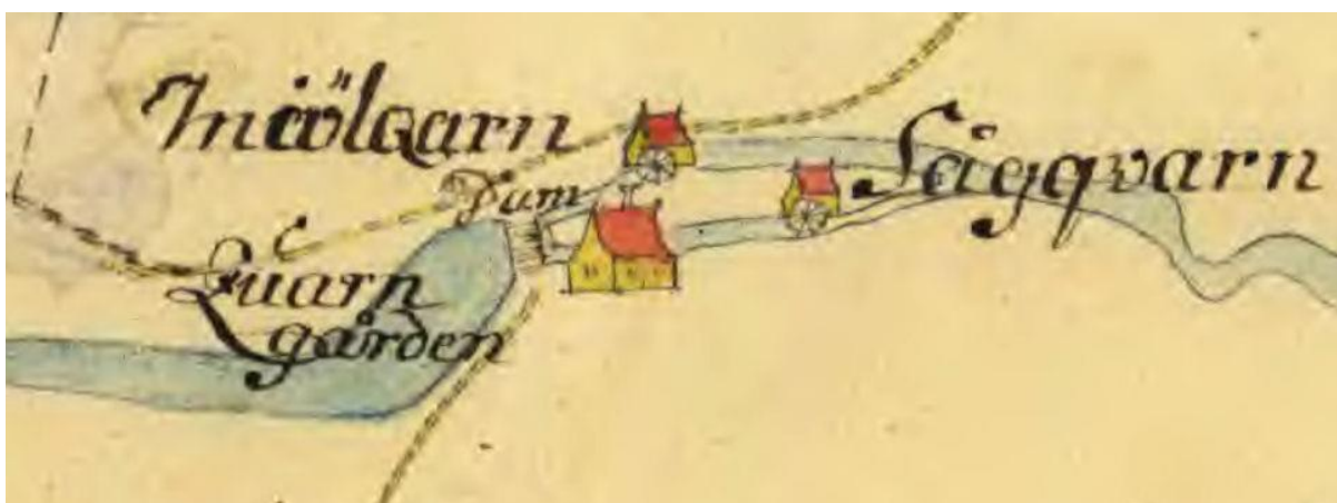
Quarngården år 1753

Quarngården visas med två kvarnar och en körbar dammbyggnad, som låg i samma läge som den nuvarande stenvalvsbron vid Gammelgården.