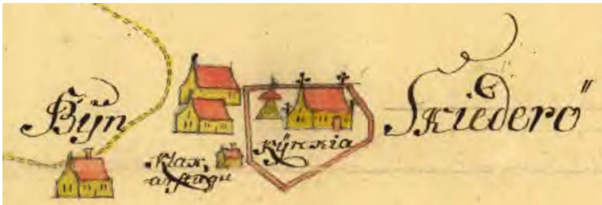
Byn Skiederö år 1753

Det finns en karta från år 1753, som bl a visar Skiederö kyrka och Quarngården. Vid kyrkan visas byn Skiederö, som bestod av 3 gårdar samt förstås kyrkan med kyrkogård, klockstapel och klockarstuga. Varje gård symboliseras med ett hus.